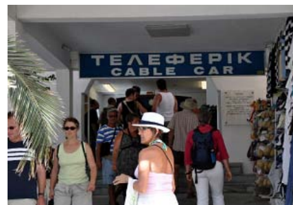
Entrada en Fira