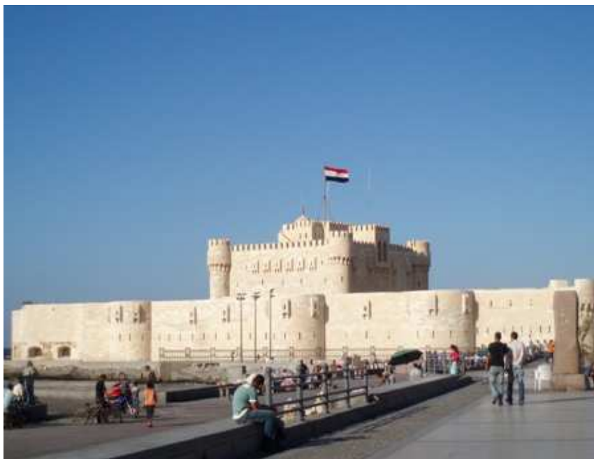
Fortaleza del sultan Qaitbey

COMO LLEGAR AL CENTRO: Los sitios de interés están a pocos pasos del Puerto Oeste, donde llegan los cruceros. Para los puntos más distantes, es aconsejable coger un taxi.